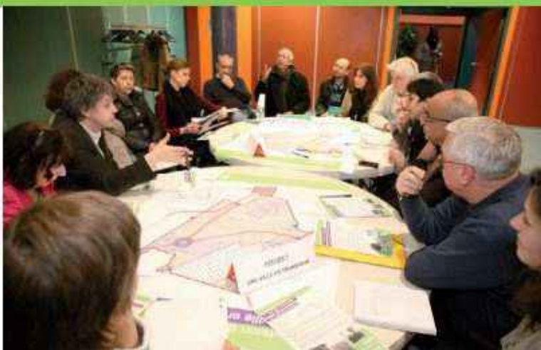
Travail sur plan pour réfléchir notamment aux centralités et aux axes de circulation dans la ville.

Après la réunion publique du 27 novembre et la balade du 17 janvier, organisée dans le but de recueillir la parole des habitants, ces ateliers de la révision du Plan Local d'Urbanisme (PLU) ont permis d'échanger sur ses grands enjeux à l'échelle du territoire communal et d'aborder des thématiques telles que le patrimoine, le cadre de vie, les transports, le logement et l'emploi. La municipalité souhaite associer les Balnéolais aux réflexions préalables pour la construction du futur Projet d'Aménagement et de Développement Durable (PADD) et du PLU. Près d'une soixantaine de personnes ont participé à ces ateliers, animés par Citadia et Aire Publique. Après une présentation des principaux enjeux du diagnostic, les participants se sont répartis en trois ateliers pour répondre à des questions concernant la ville en transition, le bien commun à mettre en valeur et une ville pour tous. Cela a été également l'occasion de se concentrer sur le devenir du site des Mathurins, éclairé par la présence de l'architecte Bernard Reichen chargé par le propriétaire de