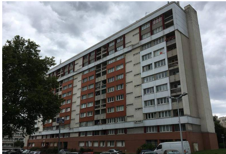
Bâtiment C - Colibri