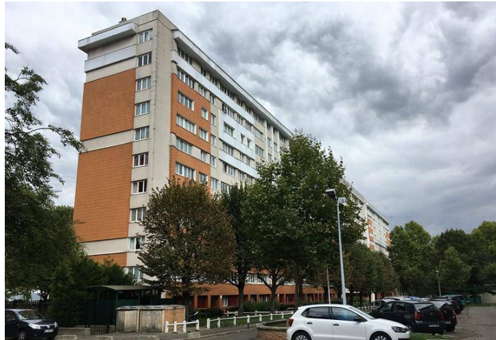
Bâtiment A - Grande Pervenche