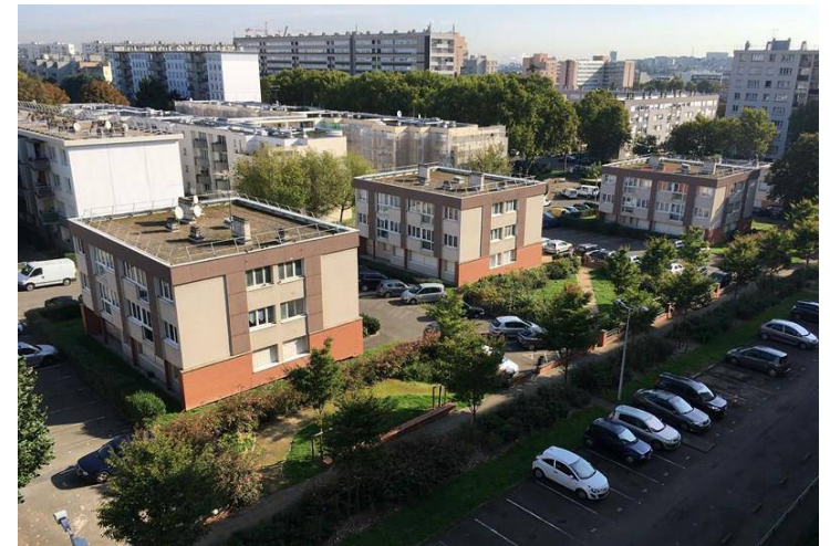
Bâtiments D, E, F et G - Chant des oiseaux