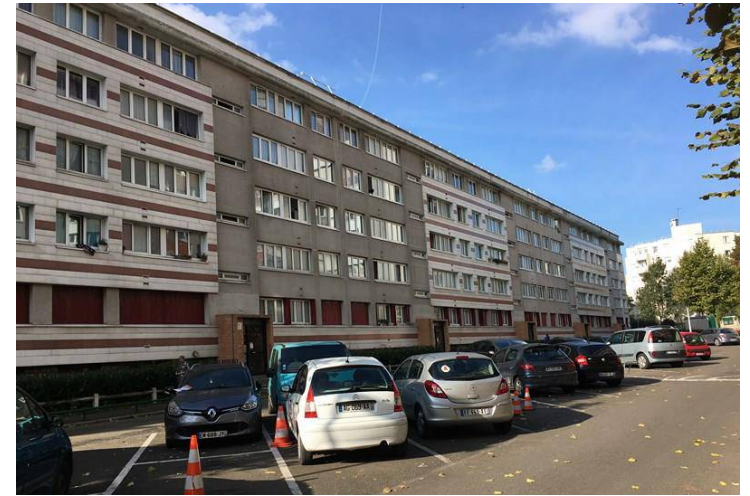
Bâtiment B - Petite Pervenche