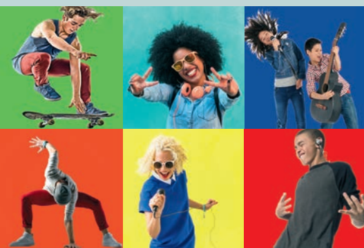
Young Talents, qu'est-ce que c'est ? P 35