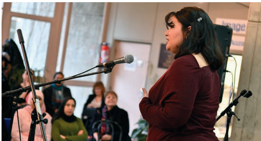
● Les habitants ont pu exprimer leurs nombreux talents lors de la scène ouverte proposée par la médiathèque Louis-Aragon, le 17 mars, dans le cadre du Printemps des poètes.