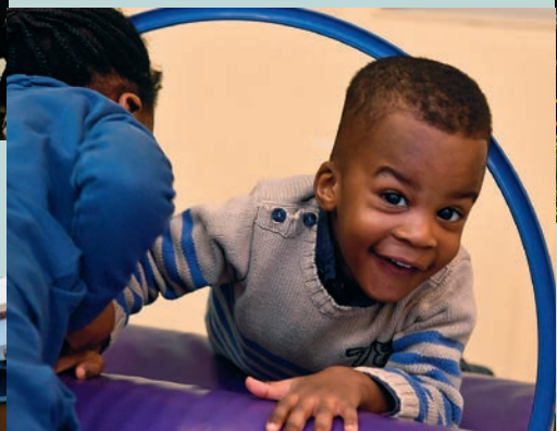
La semaine de la Petite enfance P 20