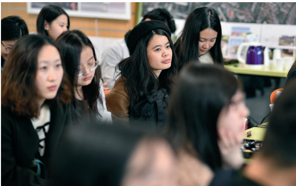
● Des étudiants en architecture de l'université de Hong-Kong étaient invités à Bagneux, le 6 mars, pour découvrir l'ÉcoQuartier Victor-Hugo.