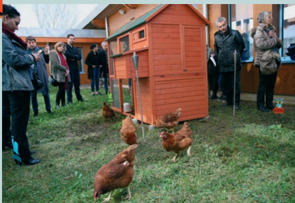
Bagneux, une ville aux airs de campagne P 12