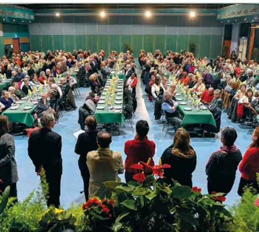
Un banquet réservé aux retraités P 22