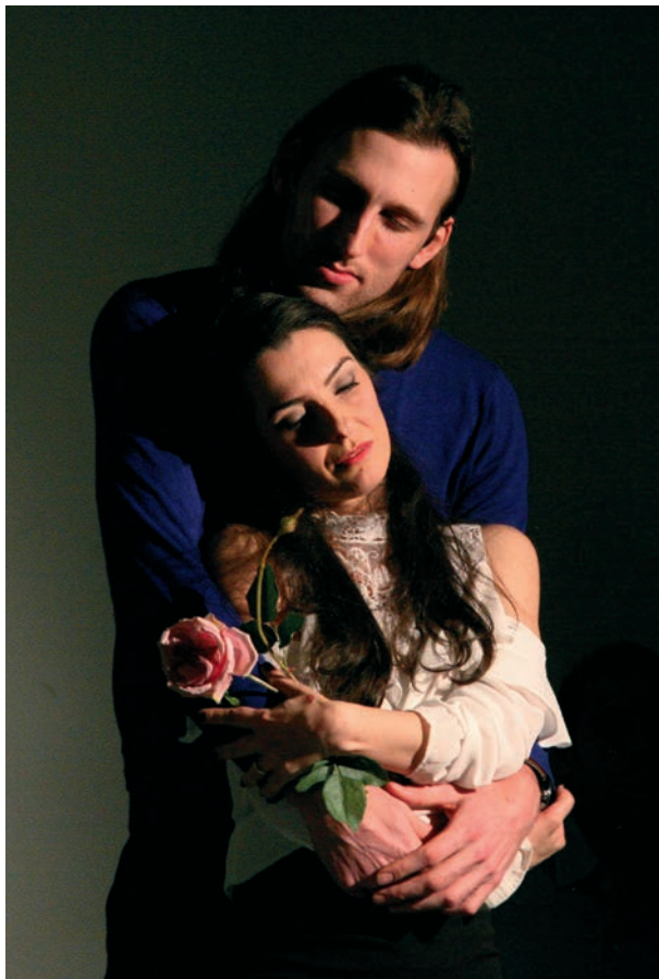
● Florabela, la sœur du rêve , c'était le titre du spectacle littéraire et théâtral proposé par l'association luso-balnéolaise, le 9 mars, salle Paul-Vaillant-Couturier.