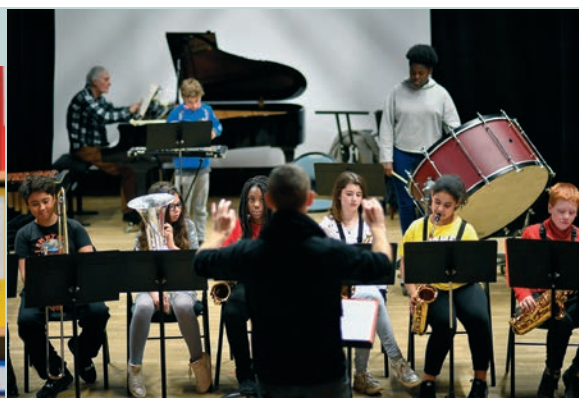
Les CHAM, bientôt à l'Olympia P 10