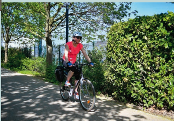
Bagneux développe les mobilités douces P 12