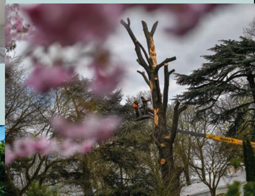
De l'arbre... à l'art P 20