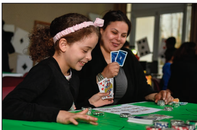
● Les habitants du quartier Sud se sont mis sur leur 31 pour la soirée Casino, organisée le 14 avril par le centre social et culturel de la Fontaine Gueffier.