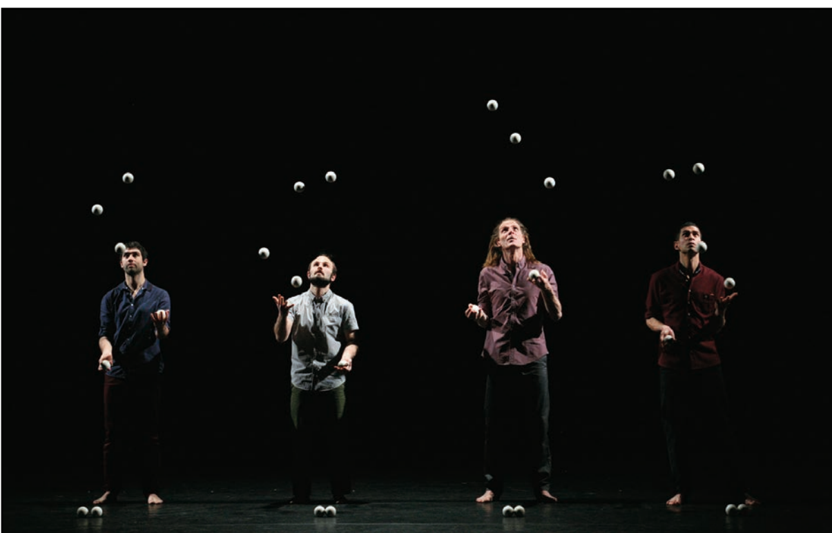
● Impressionnante performance de jonglage synchronisé, le 29 mars au théâtre Victor-Hugo, à l'occasion du spectacle Humanoptère de la compagnie La main de l'homme.