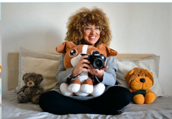
Elle capte les instants de la vie P 10