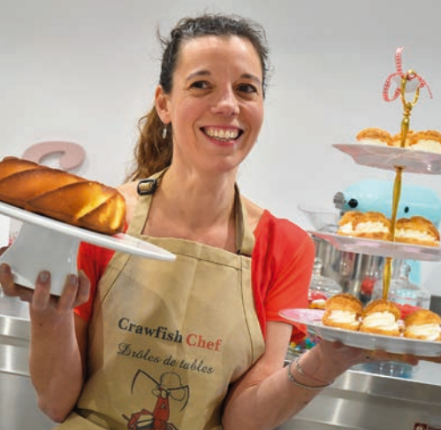
Le bonheur dans la pâtisserie P 9