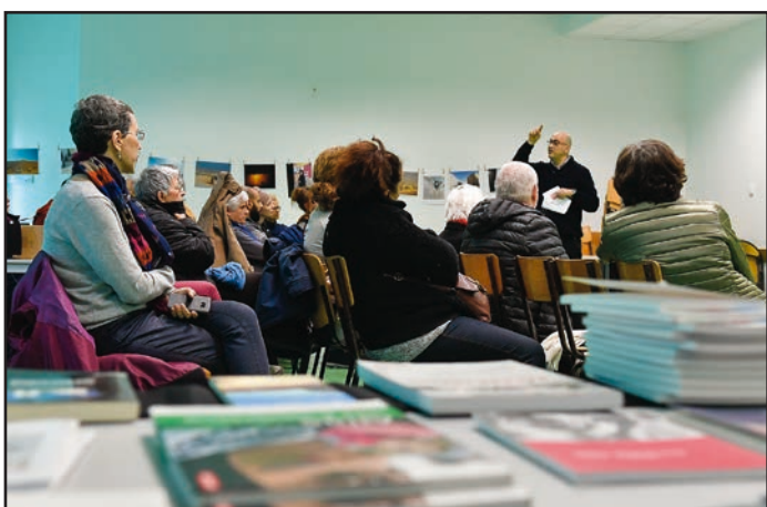
● L'association France Palestine Solidarité 92 proposait la projection du documentaire poignant "Checkpoint" de l'Israélien Yoav Shamir, le 31 mars, salle Paul-Vaillant-Couturier.