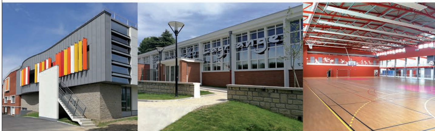
Gymnase Léo Lagrange - Maître d'œuvre : A5A Architectes / Maître d'ouvrage : Ville de Stains (93)

SYLVAMÉTAL accompagne ses Maîtres d'Ouvrage dans leur démarche de Haute Qualité Environnementale