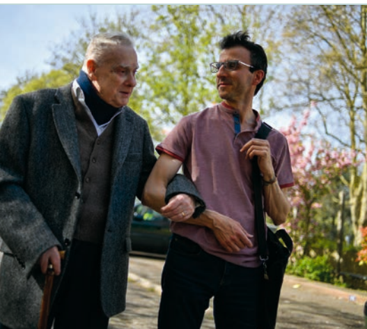
Bien vieillir à Bagneux P 24