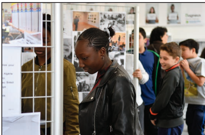
● Comme l'an dernier, des élèves du collège Henri-Barbusse ont réalisé une belle exposition photographique, poétique et littéraire, sur leur vision de la ville et de leur avenir, à découvrir lors des prochaines portes-ouvertes de l'établissement.