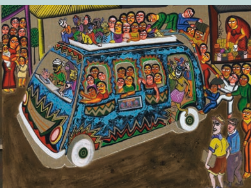
L'invitation... aux voyages ! P 34