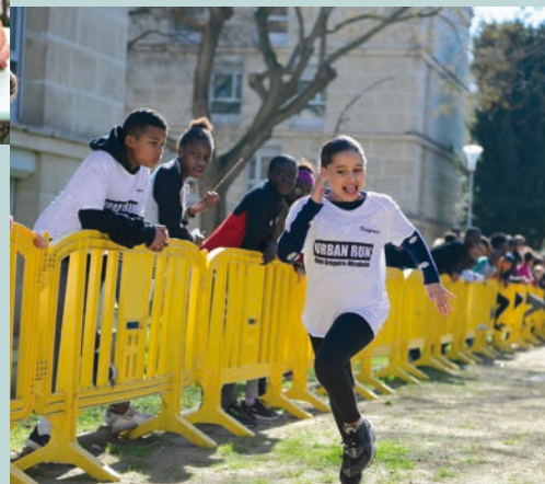
L'ambition de bâtir une ville pour tous P 12