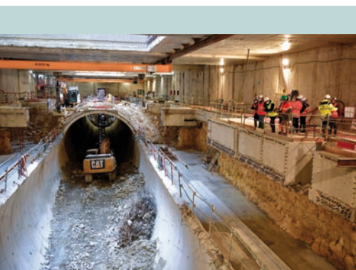
Au cœur des travaux du Grand Paris Express P 22