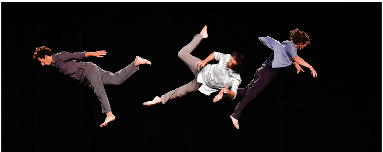
● Le Plus petit cirque du monde a présenté un spectacle d'acrobaties sur trampoline aux enfants des accueils de loisirs et des Centres sociaux et culturels au théâtre Victor-Hugo, mercredi 23 septembre.