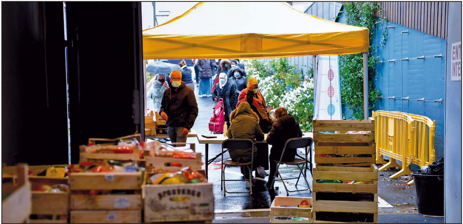
● Mardi 13 octobre, la Ville a distribué des colis alimentaires aux demandeurs d'emploi, à l'Hôtel de ville.