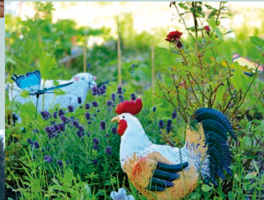
Ressentir et comprendre la nature P 20