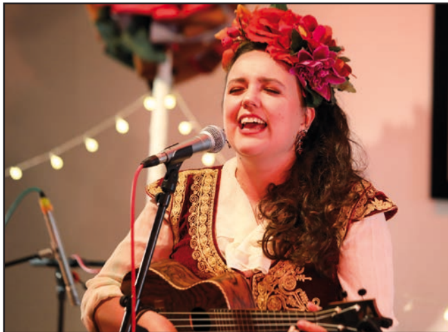
● Sur l'invitation des Studios La Chaufferie, le groupe Luna Silva and The Wonders a donné un concert folk à la médiathèque Louis-Aragon, samedi 10 octobre.