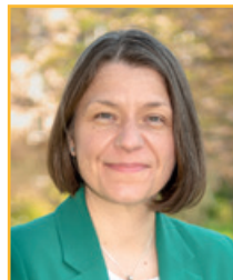
Hélène Cillières Maire de Bagneux Conseillère départementale des Hauts-de-Seine

Pour nous, les vacances sont plus que jamais un droit pour toutes et tous. Alors n'hésitez pas à inscrire vos enfants pour qu'ils s'ouvrent à de nouvelles destinations et fassent de belles rencontres. Ils reviendront ainsi des souvenirs plein la tête à vous raconter à leur retour.