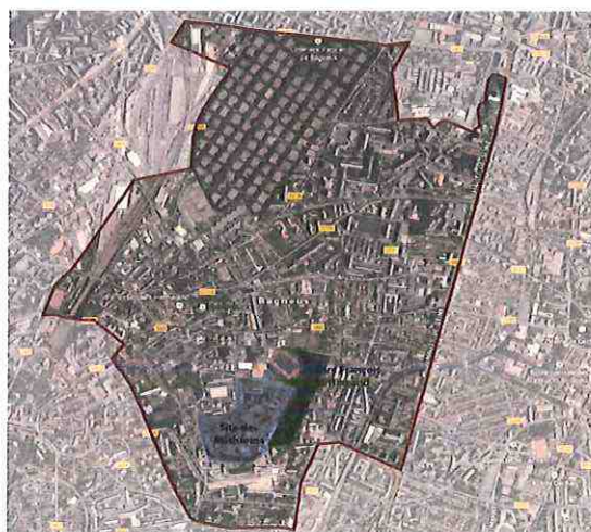
Périmètre du site des Mathurins

Le projet vise à réorganiser le maillage des voiries urbaines du site des Mathurins qui se situe au sud de la commune de Bagneux à l'emplacement de l'ancien site de la Direction Générale de l'Armement (DGA), sur une emprise de 15,6 ha.